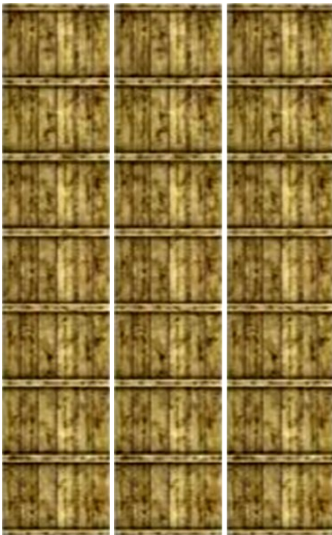
Eléments pour fabriquer le siège à l'avant, l'escalier à l'arrière et sa barre.