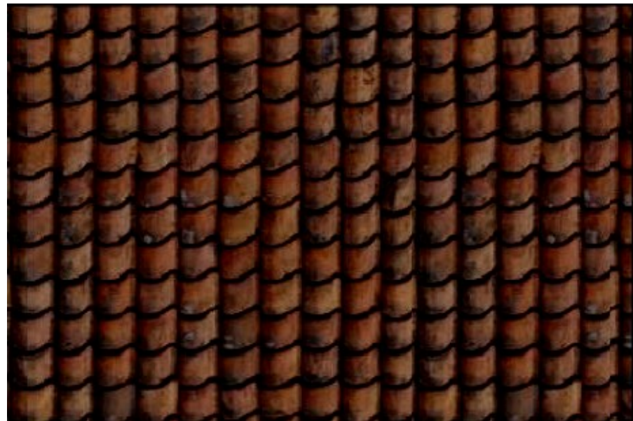
Toit: coller recto verso.